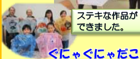
ぐにゃぐにゃだこ