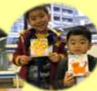
スポーツ館&フール活動